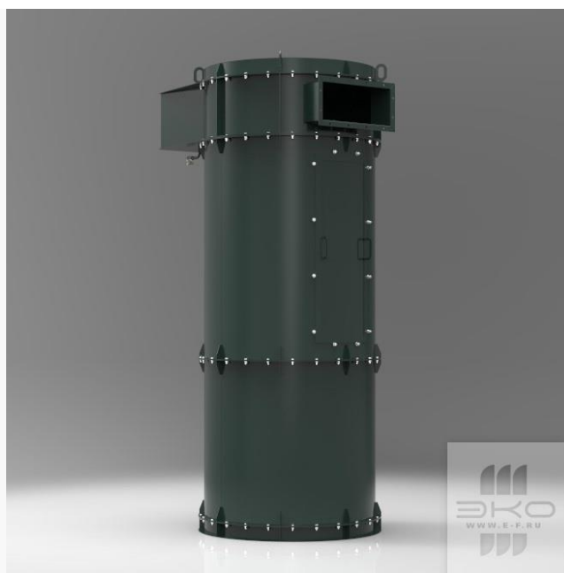
Фильтры РЦИЭ-НС без вентиляторов