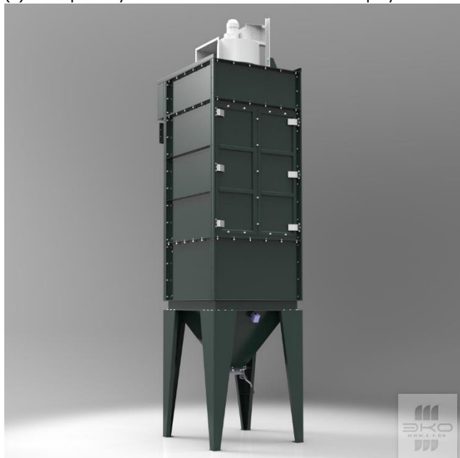
СРФ8-ВЕНТ с бункером