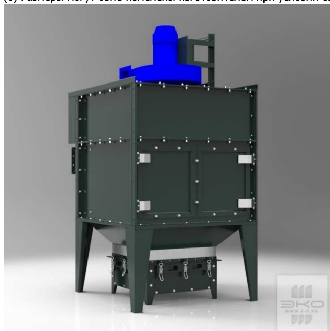
СРФ4К-ВЕНТ с выдвигаемым ящиком