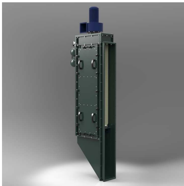
СРФ-Л2 вертикальное исполнение